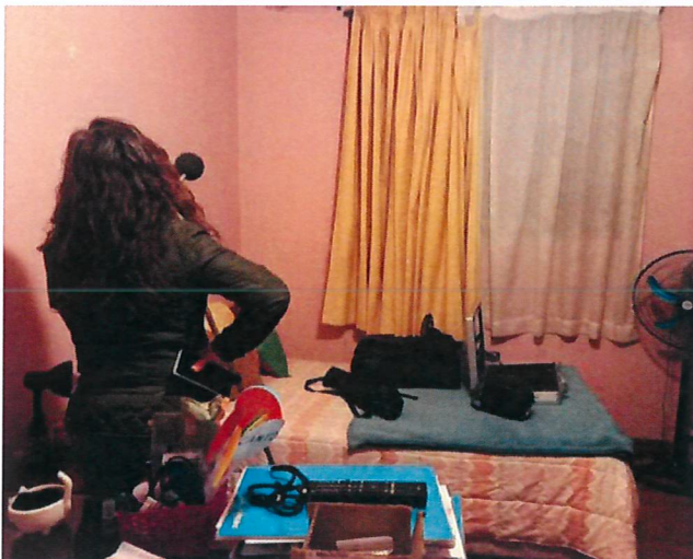
Fotografía N° 1